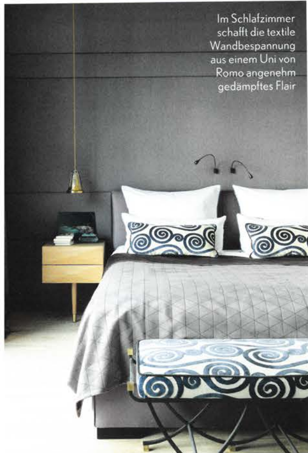
Im Schlafzimmer schafft die textile Wandbespannung aus einem Uni von Romo angenehme gedämpfte Flair

„Im Gästezimmer darf es ruhig ein bisschen verrückter sein“